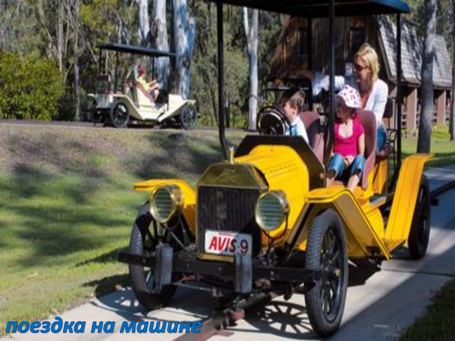
поездка на машине